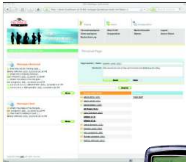
NetPage Unlimited Screen Shot