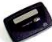
und 1-Kanal alphanumerischer Pager