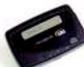
1-Kanal alphanumerischer Pager