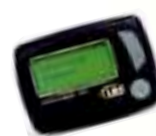
Multi-Kanal alphanumerischer Pager